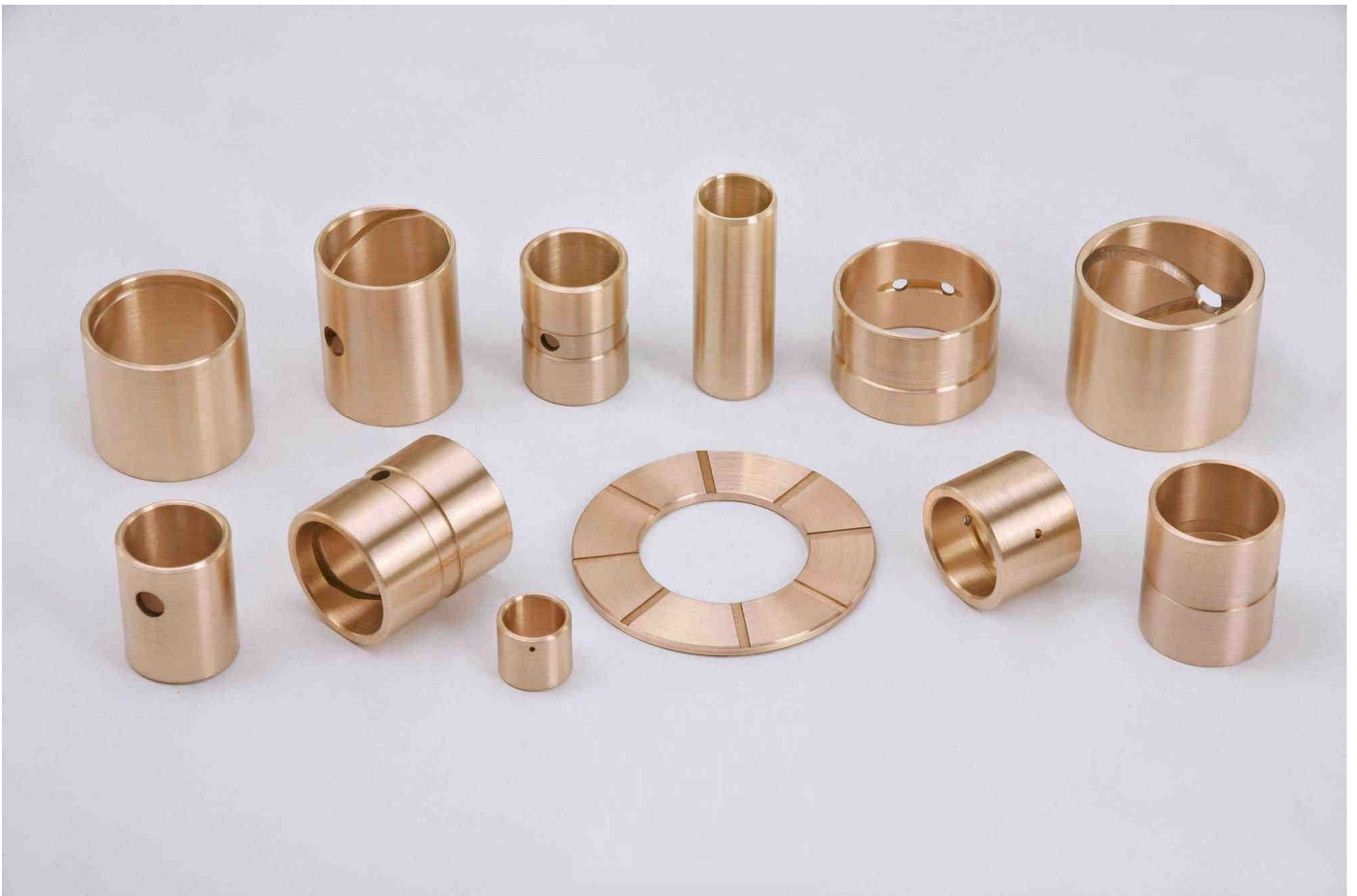
Piezas mecanizadas en bronce TVH® TV7

TRAID Villarroya fabrica una gama completa de diferentes piezas mecanizadas a partir de sus propios plásticos de ingeniería y aleaciones de metales no férricos. Partiendo de diferentes formatos, tales como barras, láminas, placas o tubos, fabricamos piezas para todo tipo de industrias y clientes. Nuestros materiales trabajan muy a menudo en variadas y desafiantes aplicaciones. Un firme compromiso siempre ha sido mantenido con los más altos estándares de calidad, así como para la protección del medio ambiente en las comunidades en las que vivimos y trabajamos.