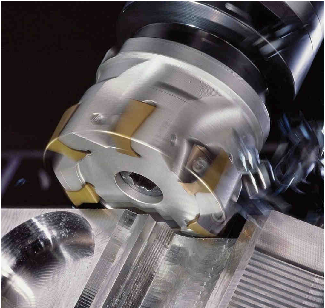
Mecanizado de nuestra aleación de aluminio TVH® TV6082.

Durante más de 45 años, nuestra empresa se ha comprometido a proporcionar tanto a los distribuidores mundiales y a sus clientes finales de piezas una calidad innovadora y alta rentabilidad en sus piezas mecanizadas. Desde nuestros humildes comienzos en 1968, la compañía ha crecido hasta convertirse en una de las mayores empresas de mecanizado profesional en España. Con operaciones en muchos países, la compañía distribuye sus piezas mecanizadas en más de 72 países bajo alguna de las mejores marcas establecidas en la industria. A nivel mundial, almacenistas, profesionales de la distribución y distintos fabricantes dependen de nuestra calidad y servicio.